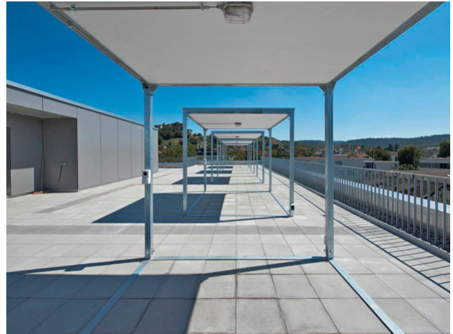
Großzügige Dachterrasse mit Blick auf Lenzburg