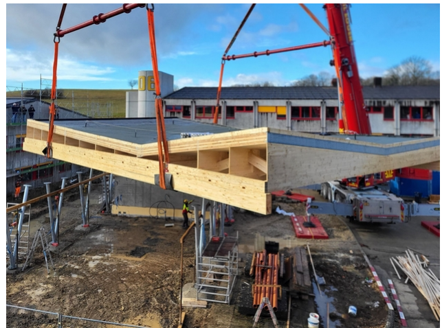
Das spektakuläre falt-/Winkeldach wird eingehoben