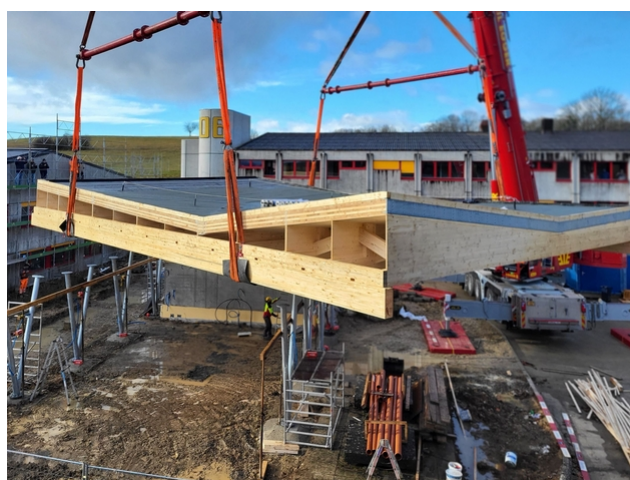
Das spektakuläre falt-/Winkeldach wird eingehoben