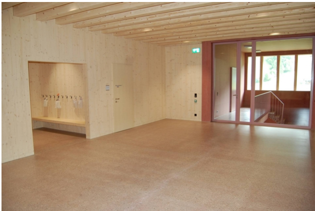
Treppenhaus mit Garderobe