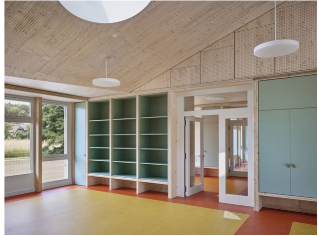
Stimmige Farb- und Materialisierungskonzepte im Innenbereich