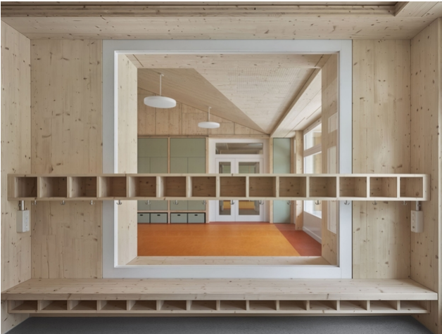
Holz als führendes Element der Innenarchitektur