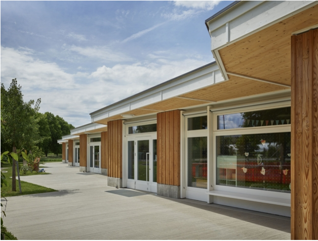
Aussenansicht nach Fertigstellung