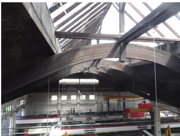
Bogenbinder mit Zugbändern