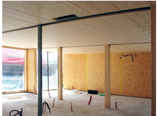
Stützen in Holz