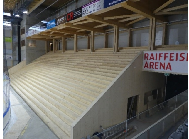
...und zu Bauprodukten verarbeitet