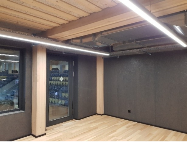
Das Holz wurde im Winter 18/19 geerntet