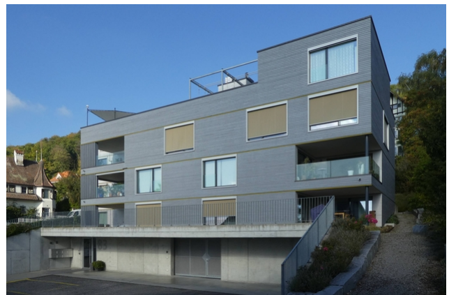
Ansicht nach 6 Jahren