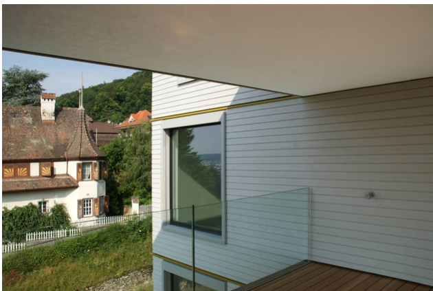
Die Terrasse

Somit erfüllt der Bau auch die hohen Anforderungen an die Ökobilanz und an den Energieverbrauch im Betrieb. Die kurzen Verkehrswege ermöglichen zusätzlich einen ökologischen Lebensstil.