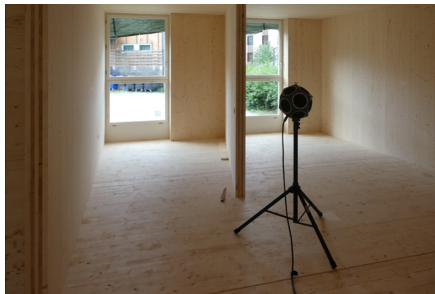
Schallmessung im Mockup