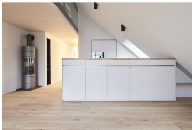
Küchenbereich mit Schwedenofen