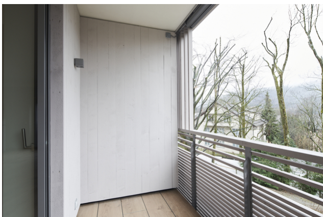
Holz an der Fassade und an den Balkonen