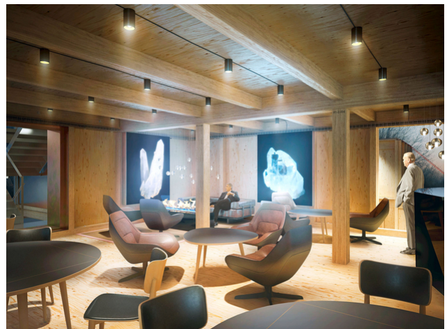
Innensvisualisierung der Lounge