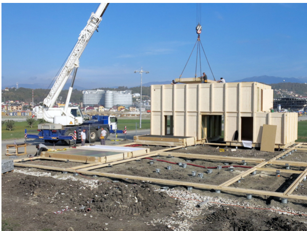
Montage in Sotchi

Die Ingenieure von Timbatec waren gefordert, ein robustes, zerlegbares, wirtschaftliches Holzbausystem zu entwickeln, das in jeder Situation stabil, sicher und regendicht war. Gelöst wurde die Aufgabe mittels einer Rippenkonstruktion, die sich sowohl in den Wänden wie auch bei den Geschossdecken und im Dach wiederholt.