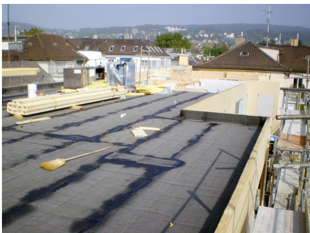
Aufstockung Erker Rohbau