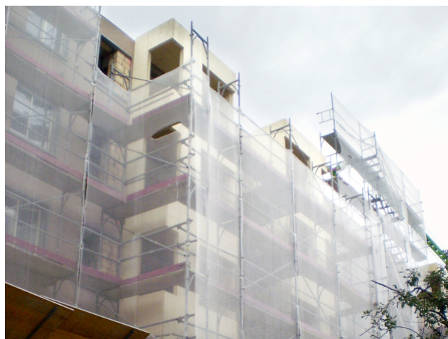
Aufstockung Erker Rohbau 2