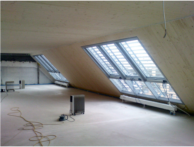
Installer une fenêtre de toit