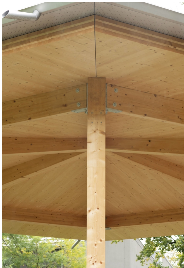
Vue sur les poteaux d'angle, raccords de poutres compris