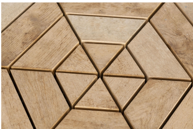
Terrasse en bois posée en hexagone