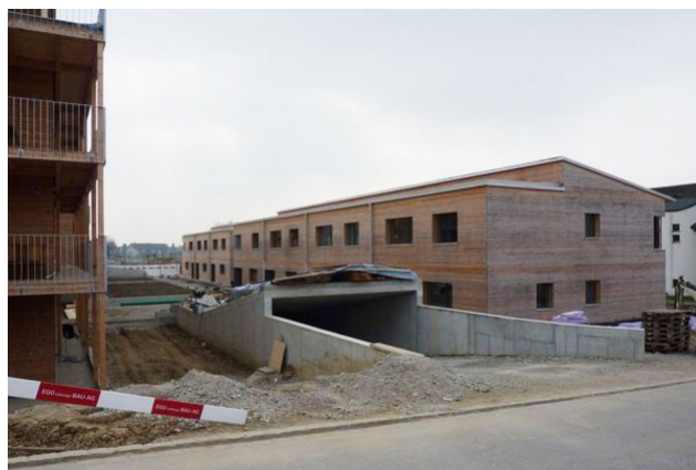
Entrée du parking souterrain