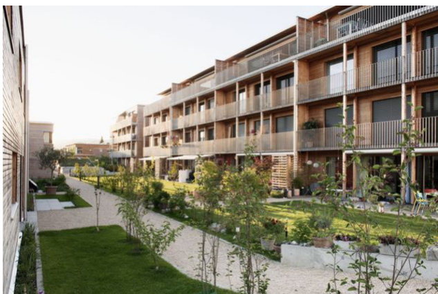
Ensemble résidentiel avec cour intérieure