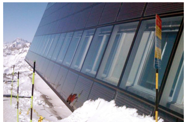
Façade avec panneaux photovoltaïques