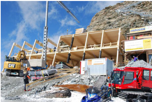
Élever le gros œuvre

Le défi était la stabilité globale, car les façades latérales / sud ne pouvaient guère contribuer au renforcement du bâtiment en raison des bandes de fenêtres continues. Les effets du vent (jusqu'à 100 m/s) et des tremblements de terre (zone IIIb) sont très élevés, ce qui a nécessité d'énormes forces d'ancrage et de renforcement. Le contreventement a été résolu par un noyau de contreventement en forme de E, composé du mur arrière du bâtiment ainsi que de trois treillis de la hauteur du bâtiment intégrés dans les murs intérieurs et placés perpendiculairement au mur arrière. Les forces de traction et de compression importantes (jusqu'à 1200 kN) provenant des poteaux des treillis sont transmises au béton par des plaques de base soudées. Ce projet a remporté le Prix Solaire Suisse 2010, catégorie B - Nouvelles constructions.