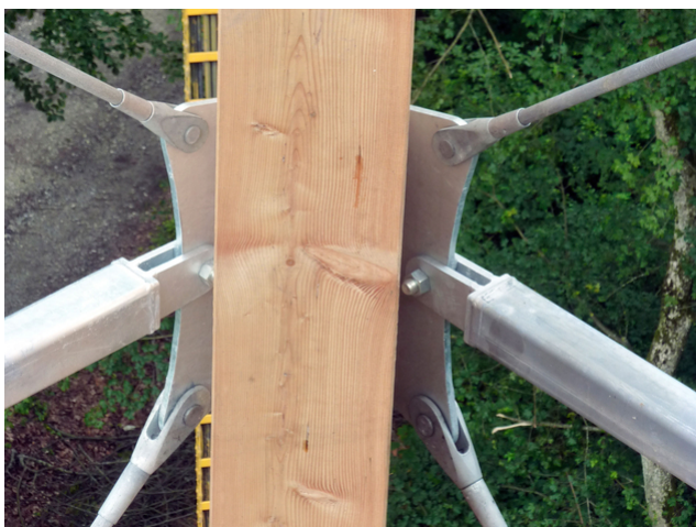
Raccord de barre de traction et de compression

Lors de la phase de concours, il a été convenu que la tour devait être construite de la manière la plus filigrane possible, à l'instar de la Tour Eiffel. Mais comment la forme de la tour Eiffel est-elle compatible avec la surface du plan ? Comment créer l'escalier et une plate-forme respectable qui offre suffisamment d'espace aux visiteurs pour une vue panoramique ? C'est ainsi qu'est née l'idée de retourner la Tour Eiffel et de la prendre en négatif abstrait dans un corps enveloppant cubique. L'escalier en spirale se tourne vers l'extérieur en forme d'escargot dans l'espace ainsi libéré, jusqu'à ce qu'il atteigne la plate-forme à 30,15 m de hauteur. La plateforme d'observation se trouve à environ 5 m au-dessus de la cime des arbres et permet une bonne vue panoramique.