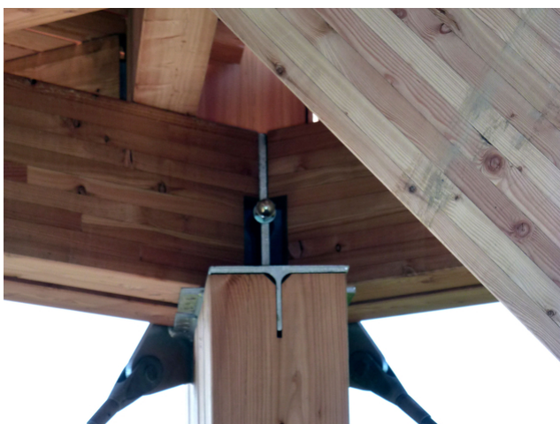
Appui Plate-forme 2