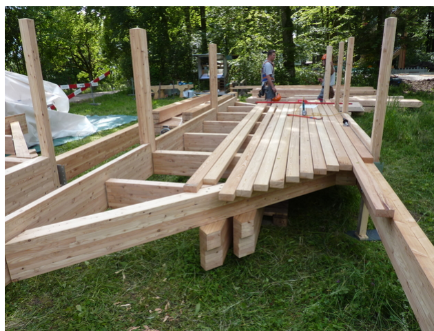
Assemblage de la tour