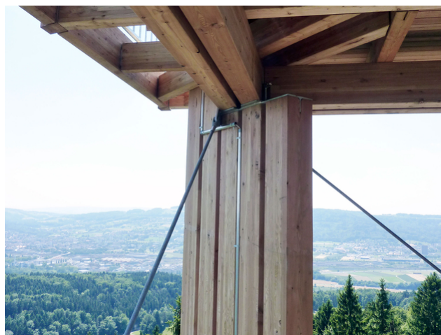
Appui Plate-forme 1

Les poteaux, limons et garde-corps intérieurs sont portés par des consoles en acier, ce qui a permis de réaliser une construction assez filigrane. Le renforcement contre les forces extérieures comme le vent est assuré par un système de tirants. La plate-forme d'observation est recouverte d'un toit en croupe composé d'éléments en caisson creux.