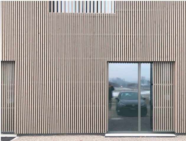
Polo Park Fabrikgebäude: Fassade aus Holzschalung