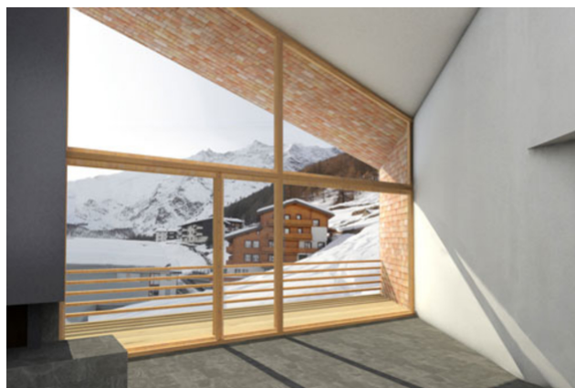
Vue vers l'ouest