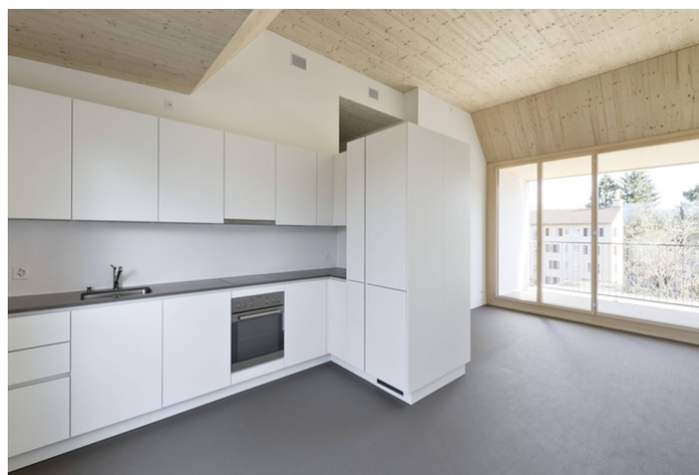
Combinaison réussie des matériaux dans la cuisine