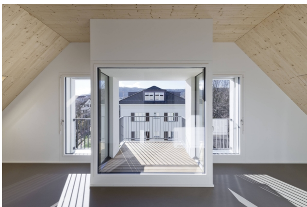
Vue depuis le balcon avec atrium intérieur