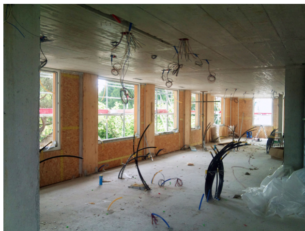
Gros œuvre intérieur