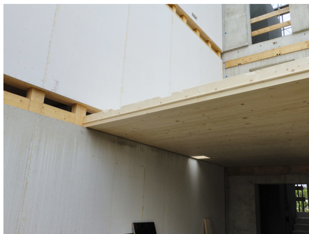
Corps, support de plafond