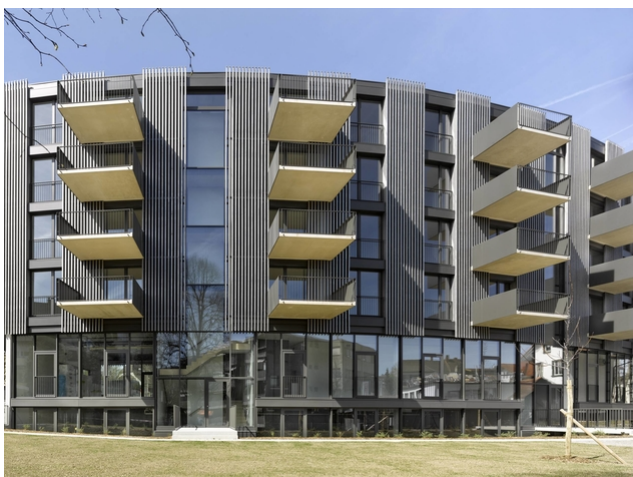
Vue de la façade avec balcons