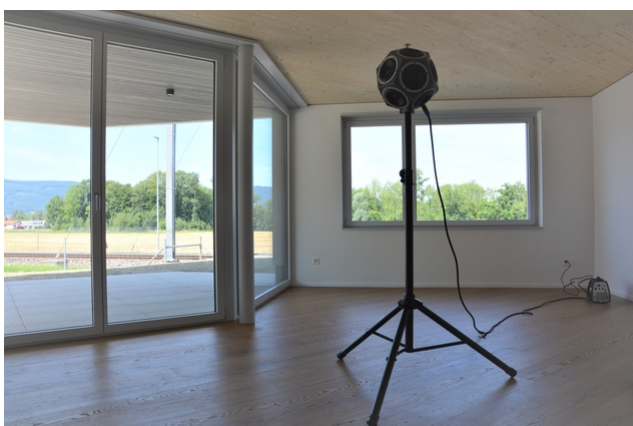
Vue de l'assemblage entre les poteaux et les dalles et mesures acoustiques