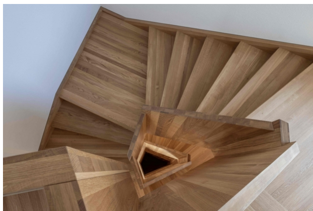
Escalier en chêne