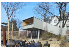
Plate-forme en bois près de l'enclos des éléphants de Bâle, Basel

A Kirchdorf, le kiosque à musique est le dernier élément du nouveau campus de formation. Il s'agit d'un solitaire isolé et visible de tous les côtés, avec la scène au sud et un arrêt de bus pour le bus scolaire au nord., Kirchdorf