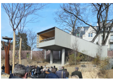
Plate-forme en bois près de l'enclos des éléphants de Bâle, Basel

A Kirchdorf, le kiosque à musique est le dernier élément du nouveau campus de formation. Il s'agit d'un solitaire isolé et visible de tous les côtés, avec la scène au sud et un arrêt de bus pour le bus scolaire au nord., Kirchdorf