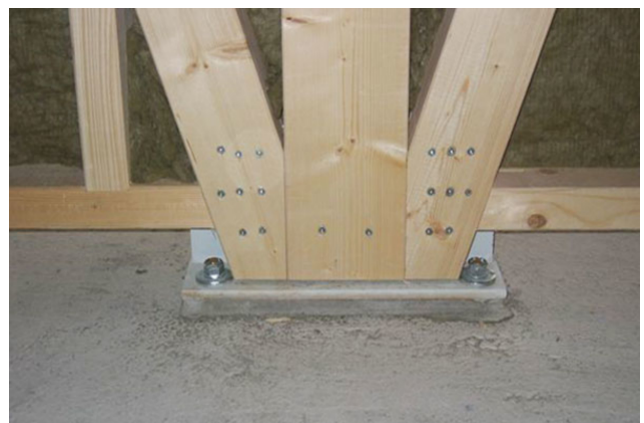
Ancrage du raidisseur sismique