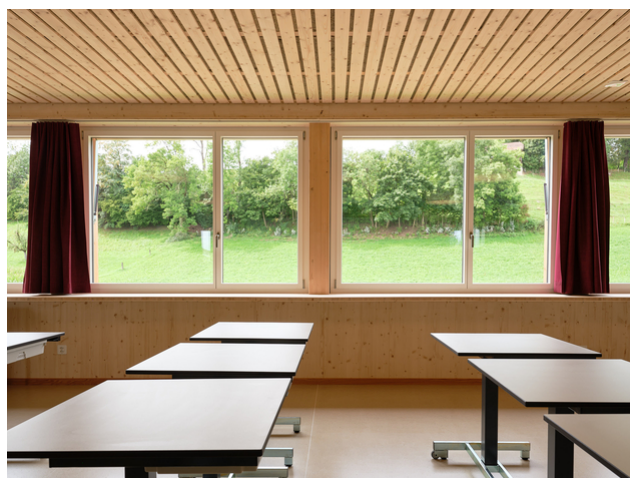
Salles de classe à l'acoustique optimisée