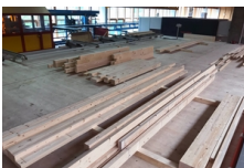
Plate-forme de travail Flück Holzbau AG, Wangen

La Simmental Arena, la nouvelle salle multifonctionnelle de Zweisimmen, est composée en grande partie de bois suisse. De plus, elle n'a pas besoin de piliers à l'intérieur. Le toit est soutenu par dix fermes en arc de 38 mètres de long., Zweisimmen