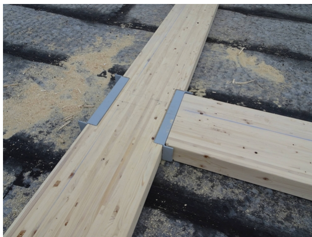
Croisement de poutres