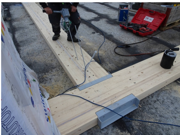
Renforcement par le haut