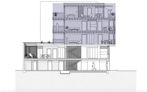
Coupe longitudinale de la surélévation