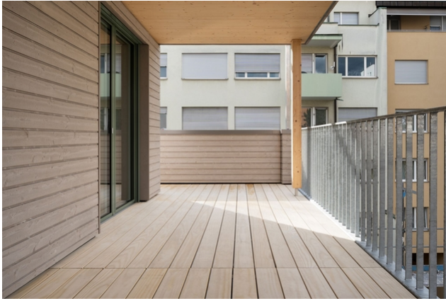
Terrasse 3ème étage