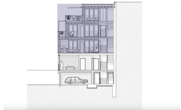
Coupe transversale de la surélévation