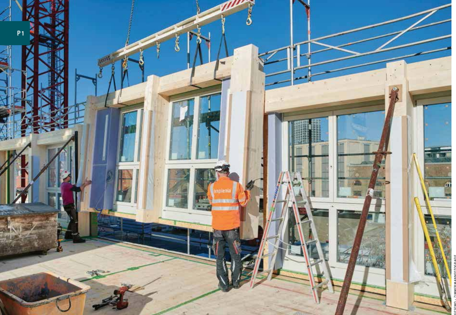
GESEWO - ZIMMERMANNFOTOGRAFIE

▲ Montage eines komplett mit Fenstern vorgefertigten Außenwand-Elements