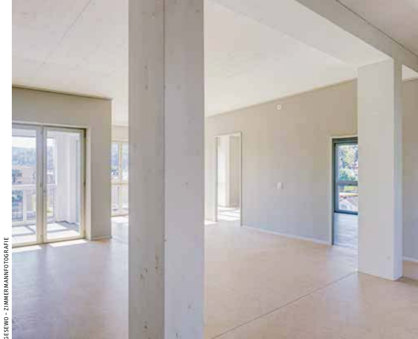
GESEWO – ZIMMERMANNFOTOGRAFIE

◀ ... wenn auch weiß lasiert. So gliedern die Tragwerksbauteile gleichzeitig die Raumstruktur