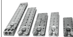
5 Größen mit 4 verschiedenen Kragenbolzen Varianten