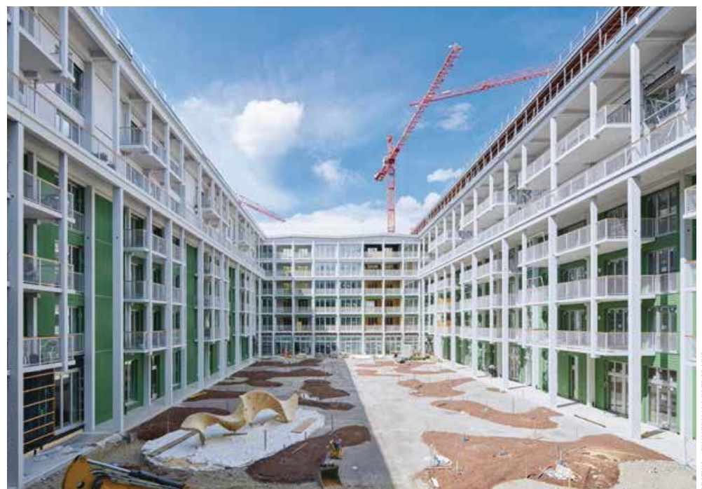
GESEWO - ZIMMERMANNFOTOGRAFIE

▼ Der ringförmig angelegte Holzbau mit Innenhof beherbergt 248 Genossenschafts-, Miet- und Eigentumswohnungen