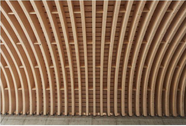
Die Holzkonstruktion bleibt von unten sichtbar