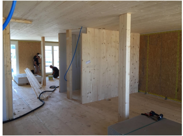
Poteaux et panneaux dans le gros œuvre